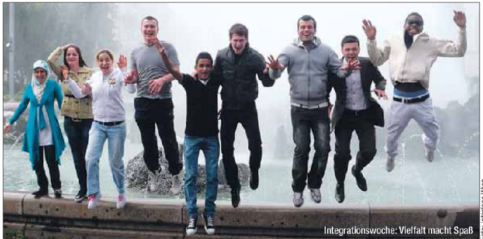
Integrationswoche: Vielfalt macht Spaß

Bereits zum dritten Mal stellt Wien das Verbindende über das Trennende.